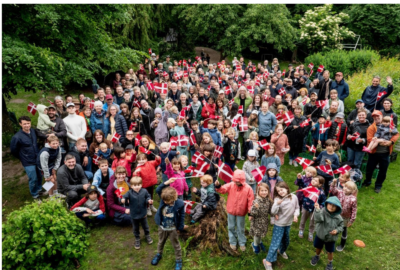
Røde Rose 2's 50-års jubilæum, juni 2024